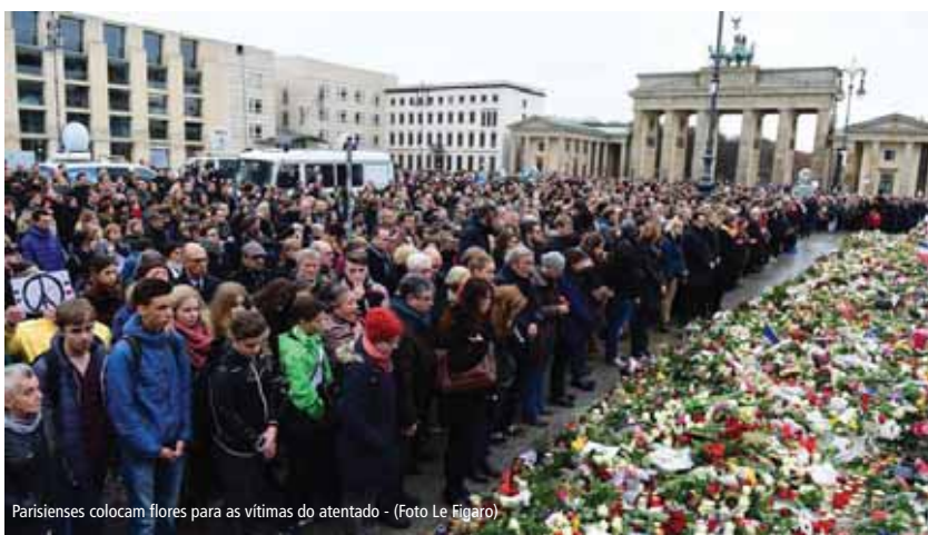
Parisienses colocam flores para as vítimas do atentado

Dias após aquela sexta-feira, o grupo extremista denominado Estado Islâmico assumiu a autoria dos ataques com a divulgação de um comunicado oficial, no qual diziam que tudo havia sido planejado e finalizam o comunicado dizendo que "A glória e mérito pertencem a Alá" e por meio de outros vários vídeos anunciam que este foi só o início. Por sua vez, o governo francês reagiu com ataques aéreos direcionados à Síria e série de investigações, com os países aliados, até localizarem os possíveis mentores dos ataques e prendê-los.