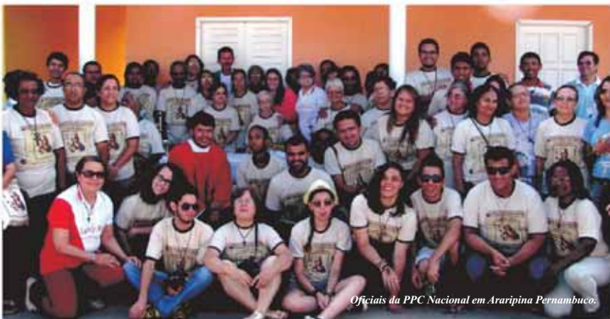
Oficiais da PPC Nacional em Araripina Pernambuco.

A equipe da Peregrinação Por Cristo (PPC) vem sendo estruturada ao longo do ano de 2015. Participamos de uma PPC Nacional, em Araripina, Pernambuco.