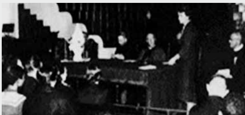
Foto da Primeira Reunião da Curia Aparecida