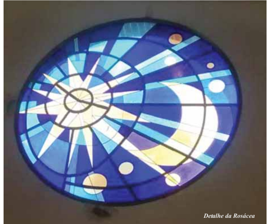
Detalhe da Rosácea

Este ano de 2015 tem sido uma benção para a Legião de Maria. Graças às contribuições da família legionária, o interior da Capela "Mãe Legionária" começa a tomar formas litúrgicas. Foram executados os trabalhos de iluminação, forro de gesso e vitrais, e o piso já está sendo colocado, acompanhando também a mesa da palavra, a mesa eucarística e a pia de água benta. Uma mesa em pedra para o altar legionário permanente será colocada no Presbitério.