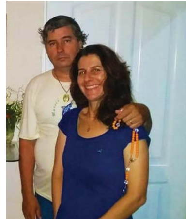
Comitium Nossa Senhora de Assunção - Araçatuba