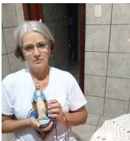
Comitium Mãe de Cristo Penápolis

Para que essa data não passasse em branco, Todos os legionários se uniram e, em comunhão, cada um na sua casa, às 18 horas (seis horas da tarde), rezaram todas as orações da Tessera, incluindo o Terço e, em seguida se consagraram NOSSA EXCELSA RAINHA.