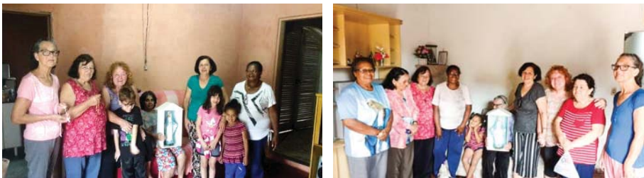
Imagem Mãe Peregrina em Lavrinhas - SP

Comitium Estrela da Manhã - Alumínio. Praesidium Imaculada de São João Novo, filiado a Cúria Divina Graça de São Roque, recebem a visita da imagem da Mãe Peregrina de Nossa Senhora das Graças rumo ao centenário da Legião de Maria pelo mundo.