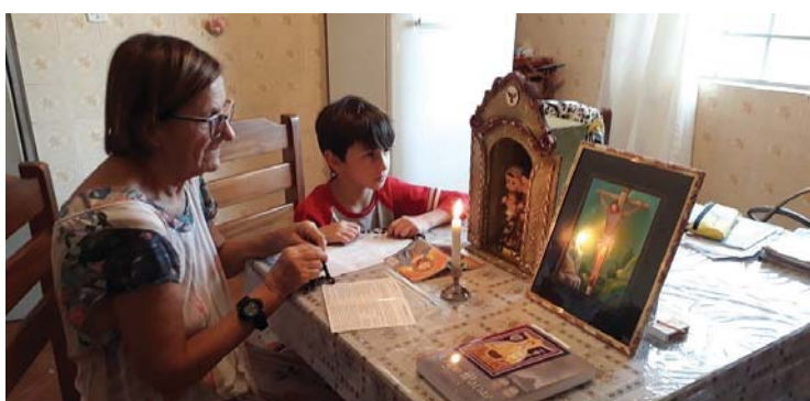
Comitium N. Sra. Aparecida - Ourinhos