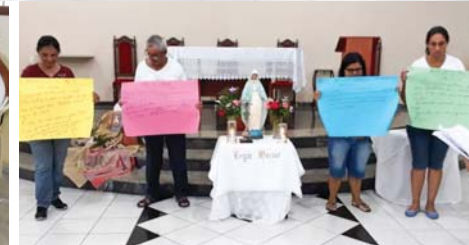
Imagem Mãe Peregrina em Alumínio - SP

Comitium Estrela da Manhã - Alumínio. Praesidium Imaculada de São João Novo, filiado a Cúria Divina Graça de São Roque, recebem a visita da imagem da Mãe Peregrina de Nossa Senhora das Graças rumo ao centenário da Legião de Maria pelo mundo.