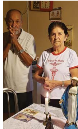
Regia Virgo Clemens - Assis