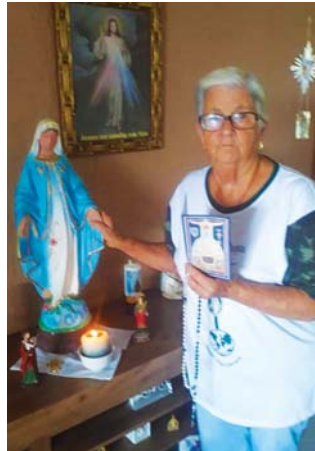
Comitium Mater Intermerata - Marília