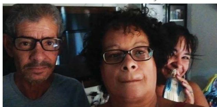
Comitium Magificat - Baurú